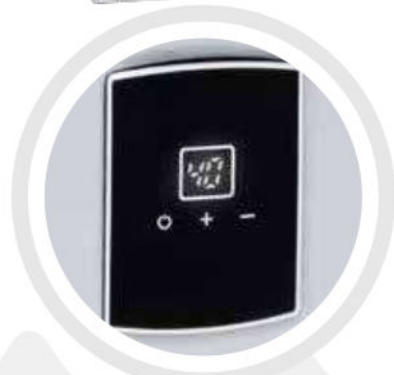
Display digital con selector de temperatura